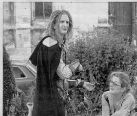
Eflam le chevalier errant débarque dans notre monde avec perplexité. Son unique mission : retrouver la mémoire et son compagnon de toujours, Lancelot du Lac