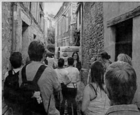
Les visiteurs sont emmenés dans les plus jolis coins de la ville de Vernon pour en apprendre tous les secrets de l'époque médiévale