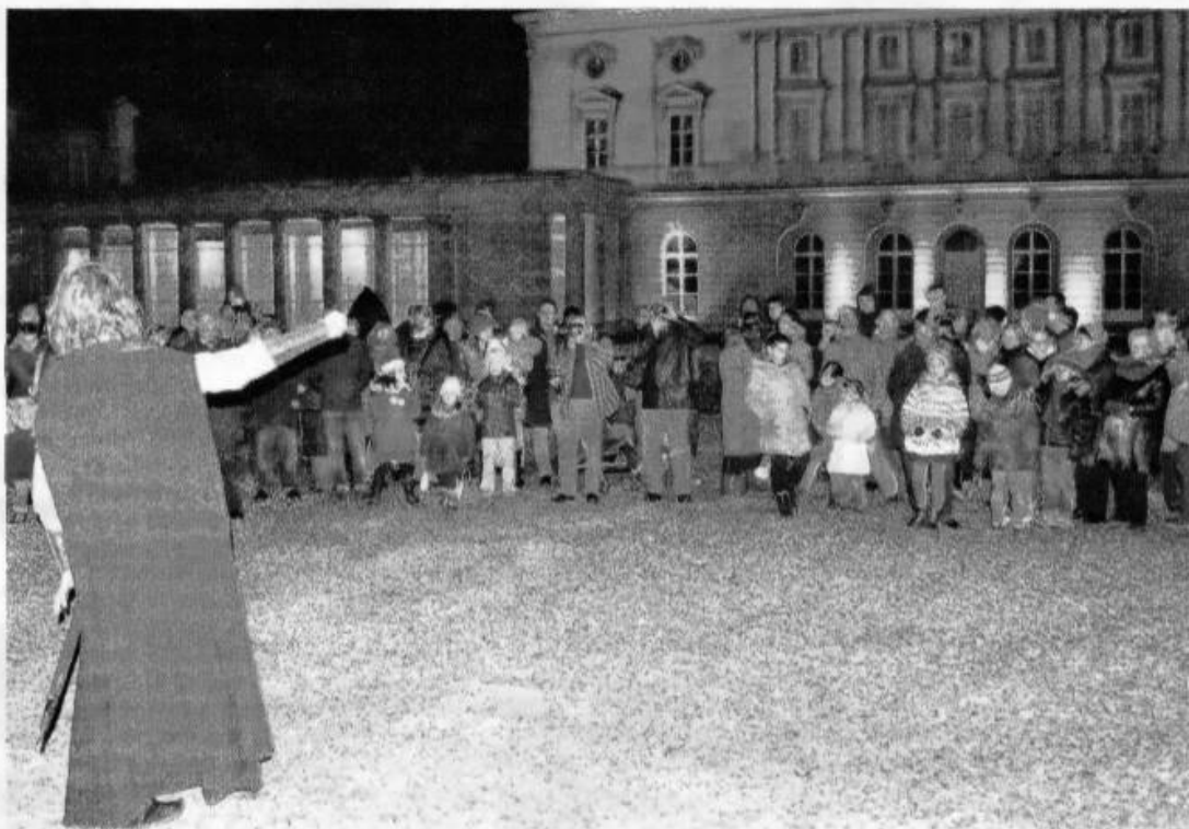
Eflam, le chevalier errant, avait déjà conquis le public l'année dernière à Bizy

« La nouveauté de cette année est que les visiteurs auront la possibilité d'acheter les pro-