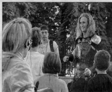
Eflam, par ses mimiques théâtrales et ses étonnements ingénus sur notre époque, sait captiver les enfants et les faire participer à l'aventure